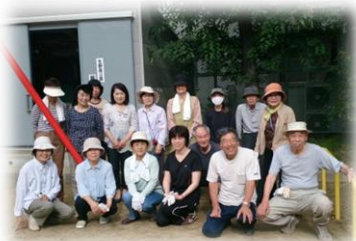
皆で頑張っています

生野区の生野南公園は、地域の7町会が当番制で、清掃作業を中心に活動され、その際、ごみの分別にも努められています。