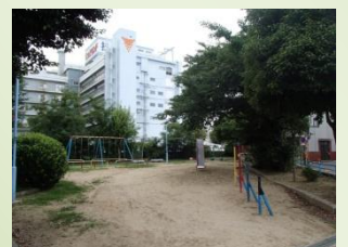
春になると桜がきれい

ちが楽しく遊んでいる光景を見るたびに、公園は安全な場所であればならないと思います。