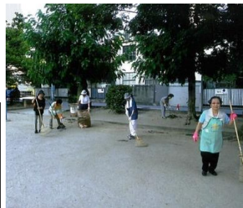
みんなできれいに

る場所として、子どもたちや保護者、地域の人たちに気持ち良く利用していただけたらと思います。これからも憩いの場所となるように愛護会活動に励んでいきます」と語られました。