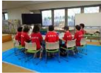
東成母子会メンバー

取り組み初日となった9月14日は、メンバーの多くが初めての花づくりということもあり、終始緊張した面持ちで、パンジー600株分の種まきを行いました。