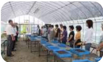
まずは、あいさつから…(阿倍野区)