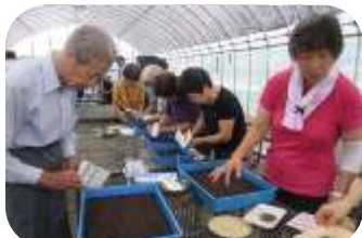
移植箱への種まき(阿倍野区)

各区のボランティアさんたちが、丹精込めて育てたパンジーやストック、マリーゴールドなどの花々は、11月ごろには市内各所を鮮やかな色に染めてくれることでしょう。