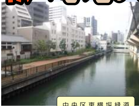
中央区東横堀緑道