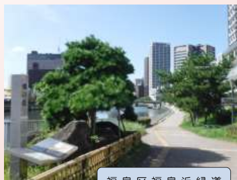
福島区福島浜緑道