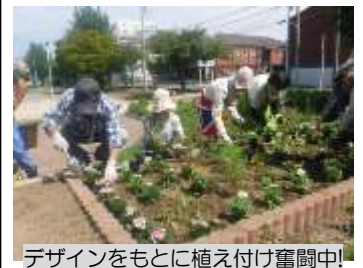
デザインをもとに植え付け奮闘中!

方法などを学びながら、ブルーサルビアやケイトウなどを、自分たちのデザインにしたがい植