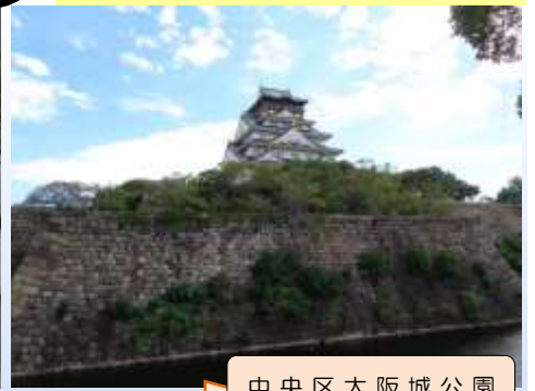
中央区大阪城公園