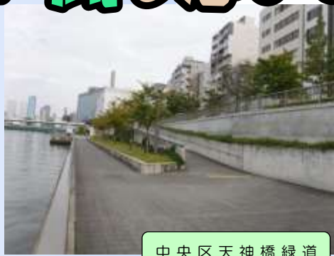
中央区天神橋緑道