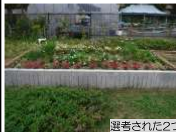
選考された2つのデザイン花壇

講習会を終えた受講者からは「暑い中、みんなで植え付けを行い、きれいな花壇ができてすごく嬉しい」「今回の花壇実習で学んだことを、私たちの地域でも活かし、きれいな花で美しい街にしたい」などと語られていました。