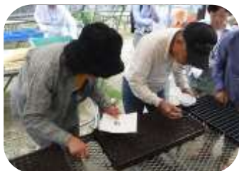
プラグトレイへの播種(平野区)られ、地域を彩る花づくりに貢献されています。

参加いただいた方々は、小さな種のアつかいにとっても苦労されながらも、和気あいあいと作業を進め