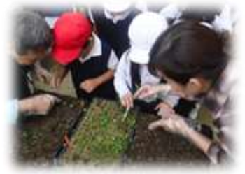
鉢上げ作業の様子

また、ボランティアさんは「学校中が、花づくり事業で育てたパンジーやノースポールなどの美しい花々でいっぱいになり、卒業式には、