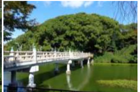
茶臼山と和気橋(2014年10月28日撮影)