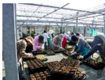
花博記念公園鶴見緑地内の新しい花づくり広場