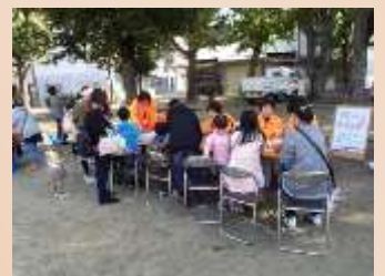
体験コーナーも盛況