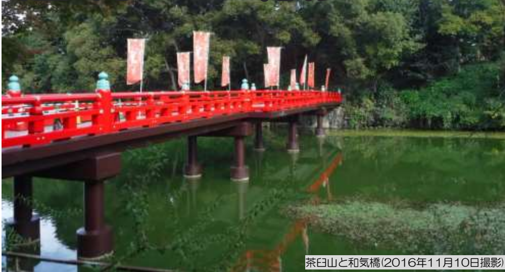
茶臼山と和気橋(2016年11月10日撮影)