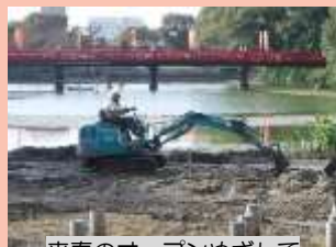
来春のオープンめざして

次に、河底池に足場を設置しての和気橋の塗装では、ボートが利用されるなど、かなり大がかりな作業が行われ、現在は、その姿を一新し、水面に美しい真紅の色を映し出し、紅葉する樹木と共に、秋の風景の一部になっています。