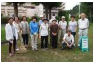
愛護会の皆さん(右端が会長)

に子どもが増え、遊びに来る姿を見受けます。子どもたちに、安心して遊んでもらえるように、清掃の行き届いた美しい公園にしていきたい」と語られました。