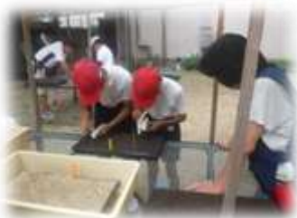
種まき指導するボランティアさん

9月12日、卒業式の時期に、色とりどりの花々で学校を彩り、卒業生たちへ思い出に残る