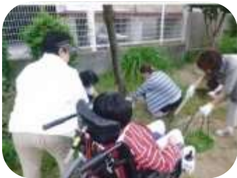
清掃もなかなか大変

阿倍野区の三明町北公園は、周辺を住宅に囲まれ、日ごろからお年寄りや子どもたちが利用すると共に、桜の時期に