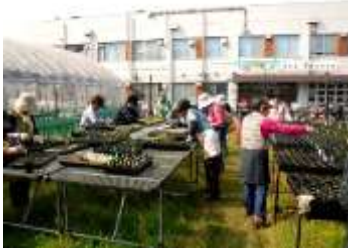
鶴見区花づくり広場 (今津)

鶴見区では、平成2年(1990年)に開催された花の万博の理念に基づき『花いっぱいの街づくり』を、現在も継承しています。