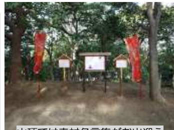
山頂では幸村名言集がお出迎え

大阪市の天王寺公園(天王寺区)は、昨年秋にリニューアルオープンしたエントランスエリア「てんしば」につづき、茶臼山エリアでは、園路の舗装や芝生広場の設