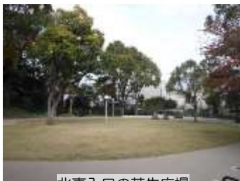
北東入口の芝生広場

標高26mの茶臼山は、徳川幕府と豊臣家が争うこととなった大坂の役において、徳川家康が大坂冬の陣(1614年)、真田信繁(幸村)が大坂夏の陣(1615年)で本陣を置いた場所として、歴史的にも重要です。