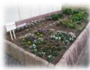
きれいに管理されたふれあい花壇

島愛護会長は「公園が、街で一番美しいのは、地域の皆さんの力で支えられているからです。これからも、公園を中心とした地域コミュニティを図れるように、頑張っていきます」と力強く話されていました。