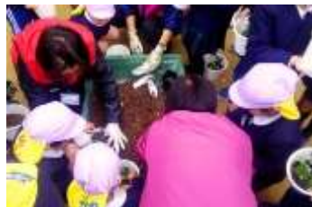
12月20日：地域ボランティアの皆さんに教えてもらう鶴見菊水幼稚園の園児たち

れ、小さな手を上手に使いながら、区の花づくり広場(今津・鶴見緑地)で育てられたパンジー