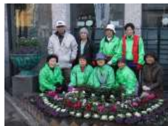
花みどり友の会の皆さん

くりの推進に繋げていただきたい」と挨拶された後、地域の方々と清掃活動に参加されました。