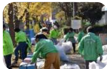
みんなで協力して

昨年12月8日、日頃から大正内港臨港緑地の清掃と除草に協力いただいている輸入壁紙専門店「WALPA(ワルパ)」と区役所の呼びかけに、大正グリーンク