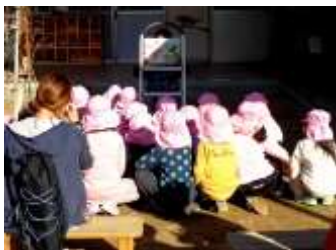
12月15日：遊具の安全講習会の紙芝居を見入る茨田第2保育所の園児たち

今回は、茨田第2保育所、鶴見菊水幼稚園、学童わらべの子どもたちを対象に取組みが行わ