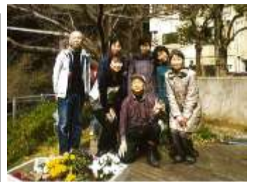
愛護会の皆さん (中央の男性が能西会長)

また、街中にあることから、会社員の方々の利用が多く、ひと時の憩いの場所となっています。愛護会では、毎週月