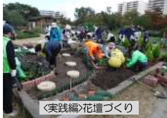
〈実践編〉花壇づくり

や区役所、地域の皆さんと連携し、講習会の講師や緑化に関する技術指導など、地域緑化の担い手として、様々な場面で活躍されています。