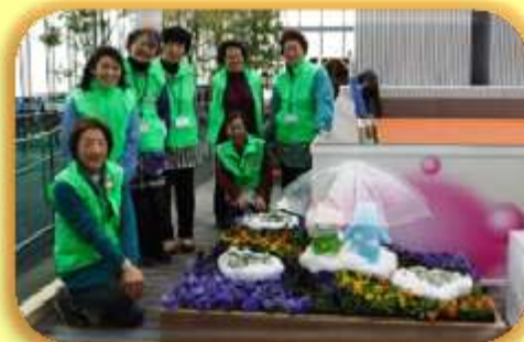
上：出来上がった花壇 下：作成中風景 右：とても嬉しそうなGCの皆さん