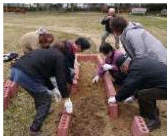
ふれあい花壇設置の様子

寄りには憩いの場、子どもたちには安心して遊んでもらえるような公園づくりをめざし、地域の皆さんと力を合わせ清掃活動などに励んでいます」と笑顔で語られました。