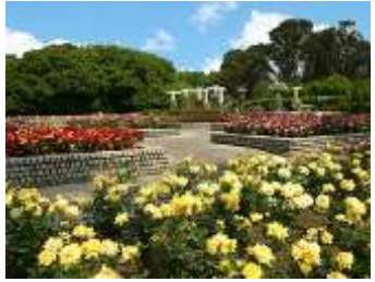
長居植物園バラ園

を巡り、各園で開催するローズツアーにご参加いただき、バラの魅力を再発見してみたいでしょうか。