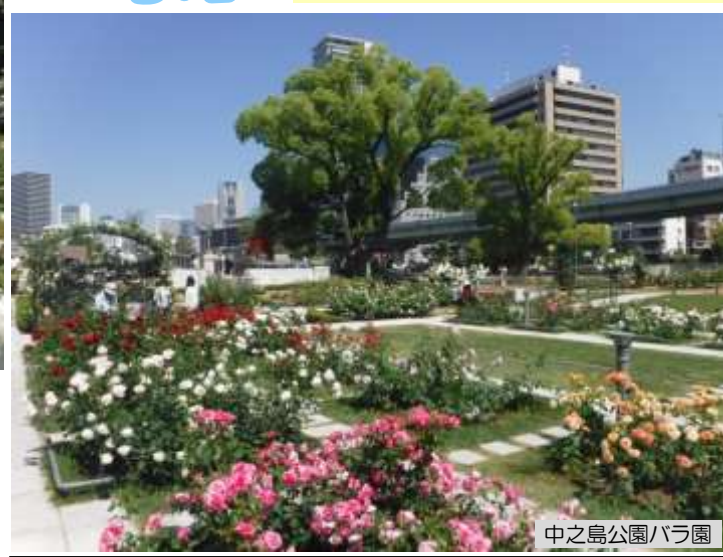
中之島公園バラ園