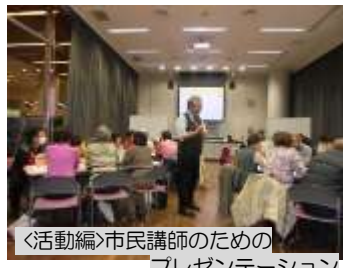
〈活動編〉市民講師のためのプレゼンテーション

花と緑の専門的な知識と技術を習得し、市民協働事業へ積極的にご参加いただける方は、是非応募してください。