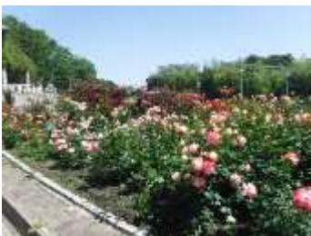
花博記念公園鶴見緑地バラ園

の開花シーズンを迎え、毎年、市内外から多くの方々にご来園いただき、園内に漂うバラの香りや品種ごとに違った色彩を見せるバラの魅力を楽しんでおられます。