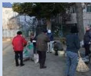
日曜日の一斉清掃の様子

また、隣接する天下茶屋小学校の児童や天下茶屋幼稚園の園児たちが、安全・安心に遊べるように、公園の点検や見守りなどにも取り組まれています。