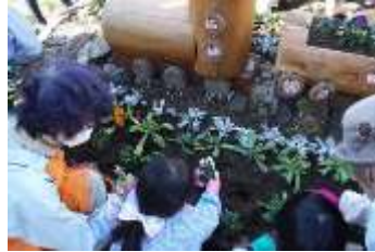
上手に植え付けました！

中央区では、種から育てる地域の花づくり事業の活動拠点の1つである南幼稚園で、未来へはばたく園児たちの思いが込められた花列車花壇が完成しました。