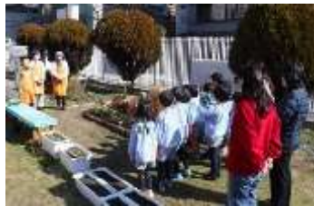
説明を聞く園児たち！

作業を終えた園児たちは「たくさん花を植えたよ」「いっぱい花が咲くといいな」などと、笑顔を見せながら楽しそうに話していました。