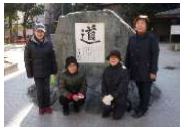
記念碑の前で！左から2人目が星野会長

ことから、周辺の道路へ飛び出さないように声掛けを行うなど、見守り活動にも力を入れておられます。