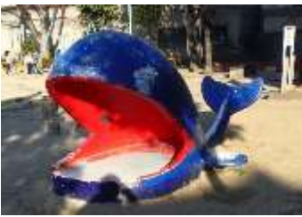
人気のクジラの遊具

生野区の巽北西公園は、市内の公園には珍しいコンクリートで出来たクジラの遊具があり、