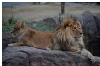
夕闇にたたずむライオン