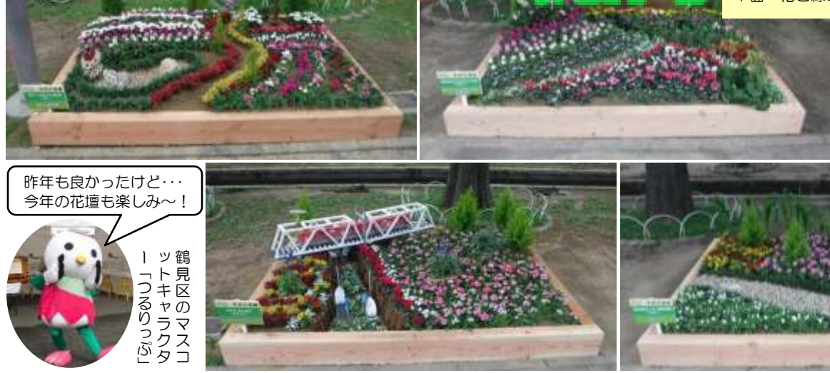
写真の市民花壇は、昨年度開催の『はならんまん2017』への出展作品。