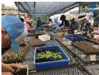
トレニア移植の様子。1回の作業で約5000株を植え替えます。皆さんの連携はさすがです。

活動している33人のボランティアさんは、担当する曜日を各自で定め、種まきから出荷に至るまでの間、お互いに助け合いながら、水やりや移植などの作業を行っています。また今年から