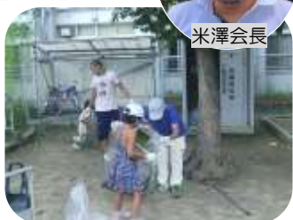
清掃活動をする町会の方々にあります。

また、積極的に行っている見守り活動では、多かつた不法投棄の減少や、遊具へのいたずら防