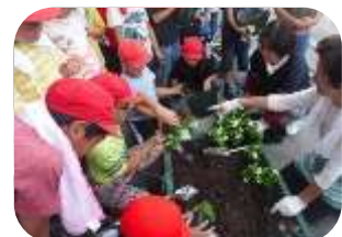
一生懸命につくる児童たち

児童たちからは、「花の植え付けには少し苦労したけど、とても楽しかったです」などと、完成した作品を前に嬉しそうなお顔を話してくれました。