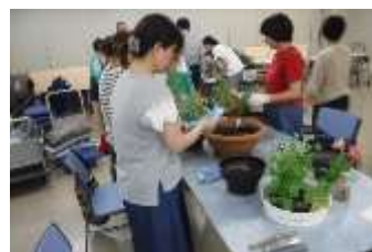
熱心に作業する参加者

最終回となった第4回目(7月10日)は、講師に浦田グリーンコーディネーター(GC)を迎え、体験談を交えた種花活