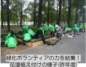
緑化ボランティアの力を結集! 花壇植え付けの様子(昨年度)

大阪市では、花と緑あふれるまちづくりを推進するため、地域の緑化活動の中核を担っているグリーンコーディネーター(GC)を中心に、緑化ボランティアのみなさんと協力 また、同時開催されている『鶴見緑地フェスタ2018』では、くすのき通やハナミズキホールなどで、秋のMakanaiマルシェや馬のデモンストラクションウォークなどが催されます。 さわやかな秋風が吹き抜ける公園を訪れ、花や緑に触れながら、心とむひと時を過ごしてみたいいかがでしょうか。