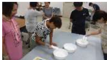
本番前の種まき練習