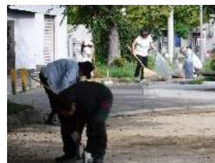
一生懸命にきれいな公園へ

愛護会では、日々の清掃活動を中心に、除草作業も積極的に取り組まれています。また公園を、町会ごとに3つのエリアに分け、一斉清掃活動が行われるとともに、ふれあい花壇には、四季折々の草花が植え付けられ、いつもきれいな公園が保たれています。