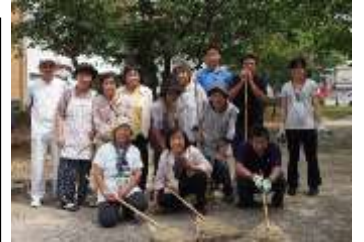
愛護会と地域の方々

また、日々欠かさず簡易清掃に取り組むとともに、毎月第4土曜日には、住民の方や周辺施設