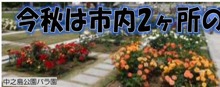
中之島公園バラ園

大阪市内のバラの名所として知られている中之島公園や靱公園などのバラ園では、職員の指導のもと、ボランティア