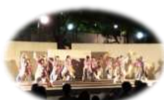
前回のステージイベント「よさこい」