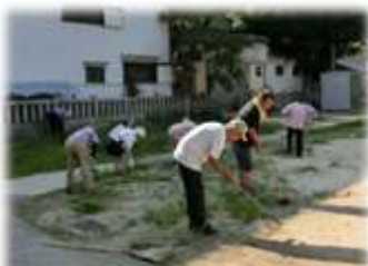
除草・清掃活動中

簡易的な清掃・点検とともに、地域の4町会が交代で、毎週日曜日に除草・清掃活動などの取り組みを行っており、清潔感のある公園を保たれています。