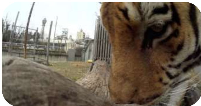
360度カメラで撮影したアムールトラの表情