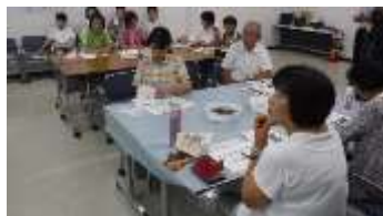
みなさん真剣な面持ちです

(GC)を講師に、4人のGCのサポートを得て行われ、パワーポイントを活用しながら、座学と実技で、種まきの難しさ