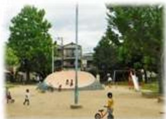
元気に遊ぶ子どもたち

東住吉区 だかあい の鷹合神社に隣接した鷹合公園は、地域の避難場所に指定されるほど広々とし、遊具も多く設置されていることから、子どもたちが元気に遊び回る姿をよく見かける公園です。