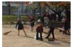
力をあわせてふれあい清掃