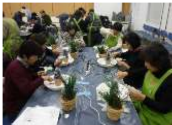
作品作りに没頭中のみなさん

きたりなどを学んだのち、補助にあたった4人のGCからアドバイスを受けながら、自分ならではの作品を仕上げ、その