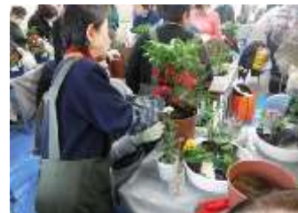
全部入るかな?【作業風景】

徴や植え付け方法などの説明を受けたのち、真剣な面持ちで作業に取組まれ、完成した自身の作品に満足げな表情を浮かべていました。