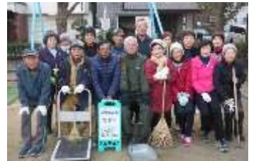
愛護会と地域のみなさん