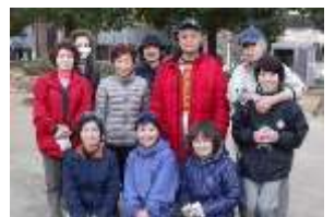
愛護会と地域のみなさん