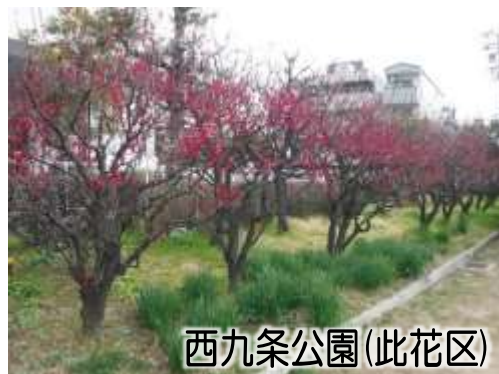
西九条公園(此花区)