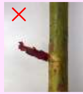
細長い芽は良くない