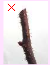
芽から遠く切り口が逆