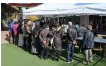
たくさん来てくれました

12月8日の“もりのみやキューズモール”では、順番待ちの列ができ、用意した50組の花苗が