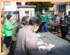
地域花壇づくりの魅力を説明(港区)

講習場所が長居公園内にあり出前講習も可能なこと、無料で花壇の手入れや花苗の植え方、デザインなどのアドバイスが受けられることを説明。参加者から「花壇完成まで協力してくれるのか」等の質問に、完成後もお伺い出来ることやホームページ「地域花壇づくり」を検索すると詳細を知っていただけることもお伝えしました。