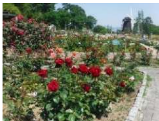
花博記念公園鶴見緑地

物園の各バラ園では例年5月初旬から下旬にかけて、春バラの開花シーズンを迎えます。