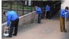
地域のかを結集して

中央区にある東横堀緑道の南側の景観が美しくなり、道行く人の注目を集めています。その理由の一つが