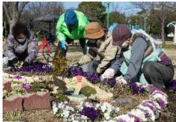
みんなで花がら摘み