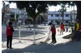
隅から隅まで綺麗に清掃します