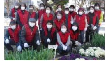
清掃活動のメンバー