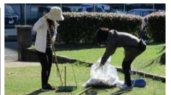
いつもきれいな公園にしています