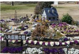
立体的な仕上がりに

港区緑化ボランティア「花みどり友の会」が、八幡屋公園内にある八角花壇を今春リニューアルされました。