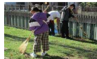
子どもたちも熱心に参加