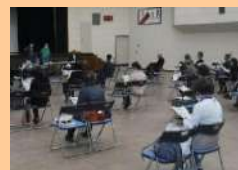
東住吉区にて説明

大阪市建設局では、地域の環境美化やコミュニティづくりの推進が出来る「地域の花壇づくり」を支援しています。2月10日に港区、15日には東住吉区の緑化ボランティアが集う会議で、花壇づくり支援の魅力を局担当者から紹介しました。