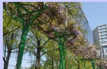
滝のように垂れ下がる藤棚(下福島公園)

滝のような薄紫や白の花々は、とても幻想的な風景です。暖かな気候の中、ゆっくりとフジが鑑賞できる公園へ出掛けてみませんか。