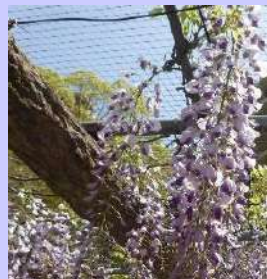
長い房のノダフジ

長い豊かな房が特徴で、2024年に発行される新五千円札の裏面図柄にも採用されたノダフジは、福島区が発祥とされており、区内にはたくさんの名所があります。中でも下福島公園、大開公園は、花を楽しむことができる公園で、例年4月中旬から5月上旬に見頃を迎えます。