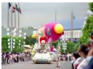
「パレード」当時の様子

平成2年の「国際花と緑の博覧会」開催から30周年を記念し11月21(土)、22(日)の両日に鶴見緑地(大阪市鶴見区)で花博開催30周年記念イベント「PARK JAM」を開催します。