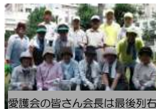
愛護会の皆さん会長は最後列右

愛護会のメンバーは、地域の憩いの場所である公園をきれいにしようと、清掃や除草などの美化活動や、ふれあい花壇の手入れなどを積極的に行っています。