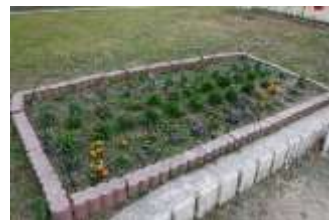
地域に好評なふれあい花壇

また、季節の花で彩られた花壇を見ていただくとう、ふれあい花壇を設置しており公園を訪れる人たちには、とても好評です。