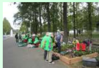
皆で楽しく花壇に植え付け