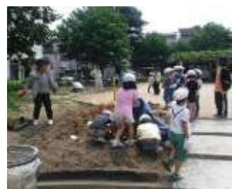
愛護会の皆さんと子どもたちが一緒にお花を植え付けています(昨年写真)