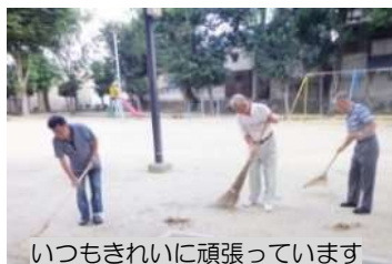
いつもきれいに頑張っています