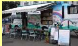
花と緑の相談車(ひふみ号)