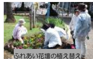
ふれあい花壇の植え替え

が訪れる一方で、ごみや不法投棄などの問題があり、毎日苦勞していますが、愛護会のメンバーや地域の皆さんの協力、公園事務所との連携で、みんなが憩える明るくきれいな公園をめざして毎日頑張っています」と熱い思いを語られました。