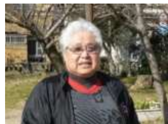
「活発な良い子どもたちばかり」と笑顔の尾家会長