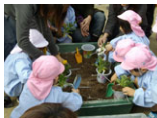
昨年は地域の園児も参加し、スコップ握って大奮闘

初めて鉢に花を植え付ける参加者も多くおられましたが、皆さん熱心に取り組んでいただきました。