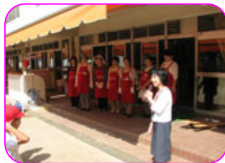
緑化リーダーの皆さんといっしょに