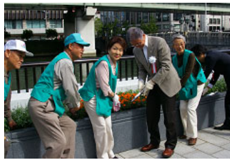
「北区バラの会」の「指導」で市長もいっしょに花の植え付け

参加した「北区バラの会」の皆さんからは、「パートナーシップ花壇が完成し、美しい草花が植えられました。