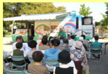
10/9 新森中央公園(旭区)での緑化講習会