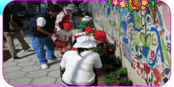
園児たちによるマリーゴールドの植え付け

り運動』で、花を育て、植えるだけではなく、もっと地域と関わりを持って、楽しく色々な活動を進めたい。」と心強い言葉をいただきました。また、鞆幼稚園の園長さんも、「日頃か