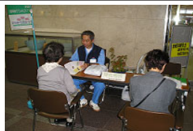
10/10 中央区役所での緑化相談