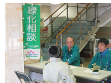
2/6グリーンコーディネーターといっしょに行った阿倍野区での緑化相談