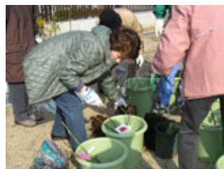
地域の方と鉢植えの準備作業

した地域ボランティア の皆さんと先生方が協 力して、「世界バラ会議 大阪大会2006」のシ ンボルとなった“ロー ズ・オオサカ”や、“ピ ンクノックアウト”など 10品種のバラ苗の植