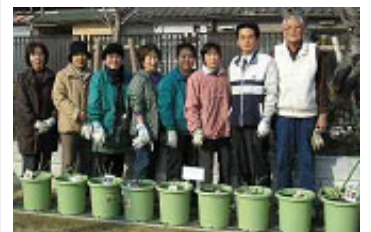
「がんばって育てます」