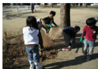
みんなできれいに