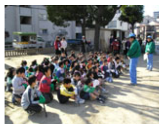
真剣に聞いてくれました

みんなで力をあ わせ、一生懸命 がんばったので、 またたく間に公 園がきれいにな りました。