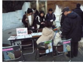
ご協力ありがとうございました

のあるしぐさで多くの入園者を魅了し、天王寺動物園の人気者となっています。署名活動はホッキョクグマ舎の前で約2ヶ月間、連日行われ、「私もゴーゴファンです」と、駆けつけた来園者の方たちも署名の呼びかけに参加