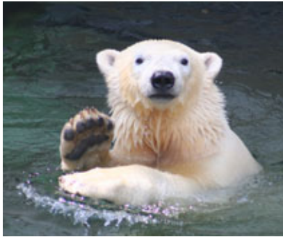
オレは待ってるぜ