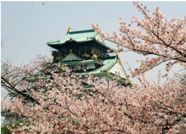
「大阪城天守閣と満開の桜」