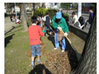
地域の皆さんといっしょに

大阪市では、地域 コミュニティの向 上と、安全・安心 ・快適な公園をめ ざした地域のさま ざまな取り組みを 応援しています。