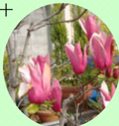
十三公園のモクレン