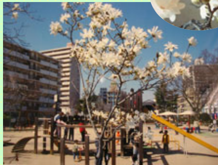
▲瑞光寺公園の“コブシ”