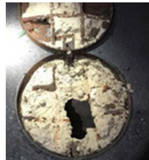
(油脂があふれたマンホール)