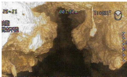
(油脂が固まった下水道本管)