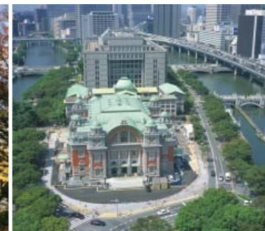
7●中央公会堂 (堂島川・土佐堀川)