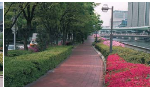
12●中之島遊歩道 (堂島川)