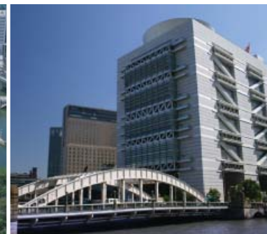
8●大阪国際会議場 (堂島川)