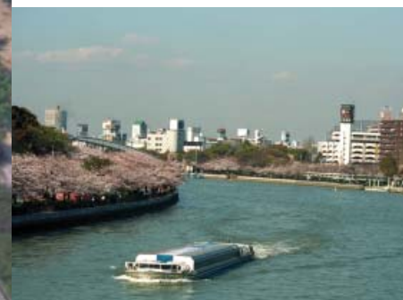
10●毛馬桜之宮公園 (大川)