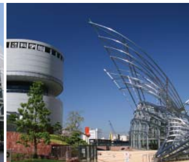
9●市立科学館 (土佐堀川)