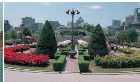
11●中之島公園一バラ園 (堂島川・土佐堀川)