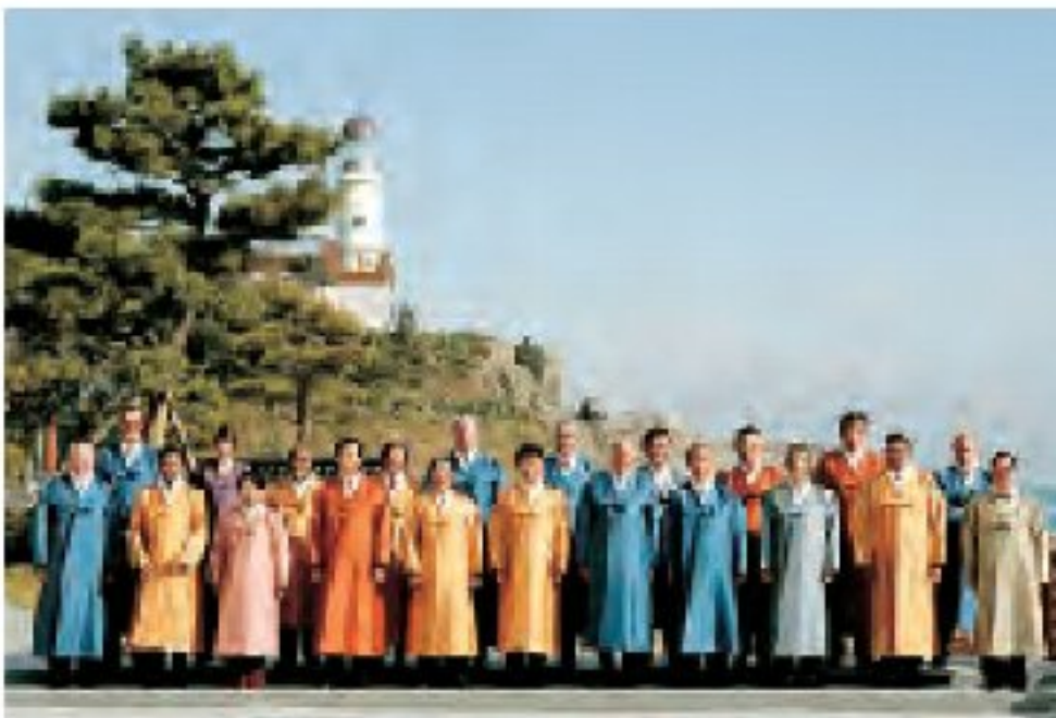
■ APEC 21カ国の代表

ヌリマルAPECハウスは、BEXCOから約1キロの冬柏島（トンベクソム）の海雲台（ヘウンデ）海岸近くに位置し、APEC首脳会談が開催された施設です。ヌリマルAPECハウスには、劇場のような構造を持つ480席の会議場、360名が入れる晚餐会場、および、10室の同時通訳ブースなどがあります。