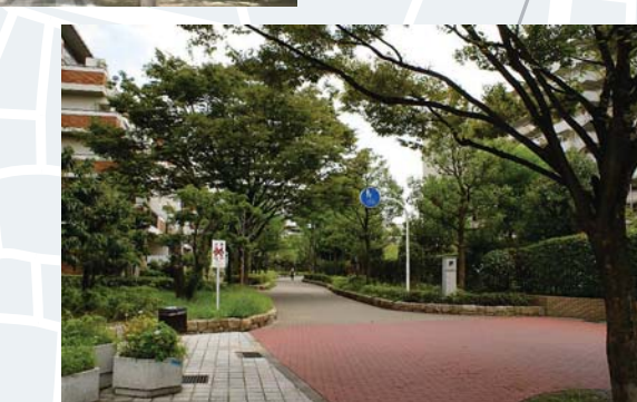
高見町歩行者専用道