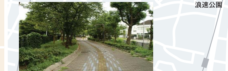
久保吉2丁目歩行者専用道