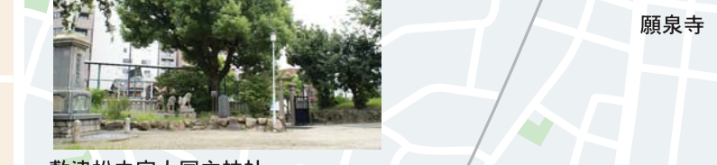
敷津松之宮大国主神社