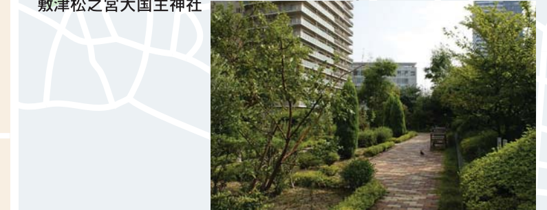
大阪シティエアーターミナル (OCAT)

発行日：2009年5月 発行元：大阪市ゆとりとみどり振興局 〒559-0034 大阪市住之江区南港北1-14-16 大阪ワールドトレードセンタービルディング17F tel. 06-6615-0963 http://www.city.osaka.lg.jp/yutori/midorii/