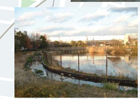
大野せせらぎの里 (大野下水処理場)