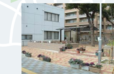
西淀川区民センター