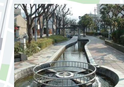
せせらぎの遊歩道