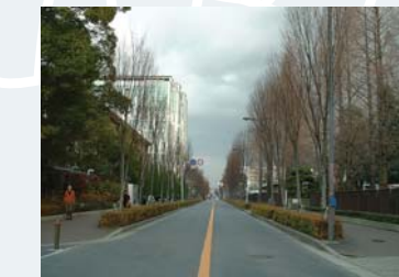
市大前ケヤキ並木

発行日 : 2009年5月 発行元 : 大阪市ゆとりとみどり振興局 〒559-0034 大阪市住之江区南港北1-14-16 大阪ワールドトレードセンタービルディング17F tel. 06-6615-0963 http://www.city.osaka.lg.jp/yutori/midori/