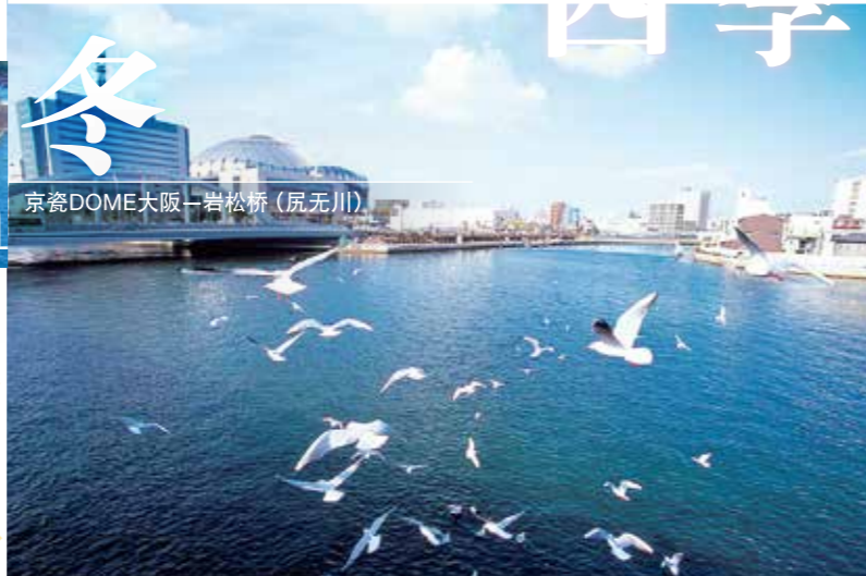
冬 京瓷DOME大阪—岩松桥(尻无川)