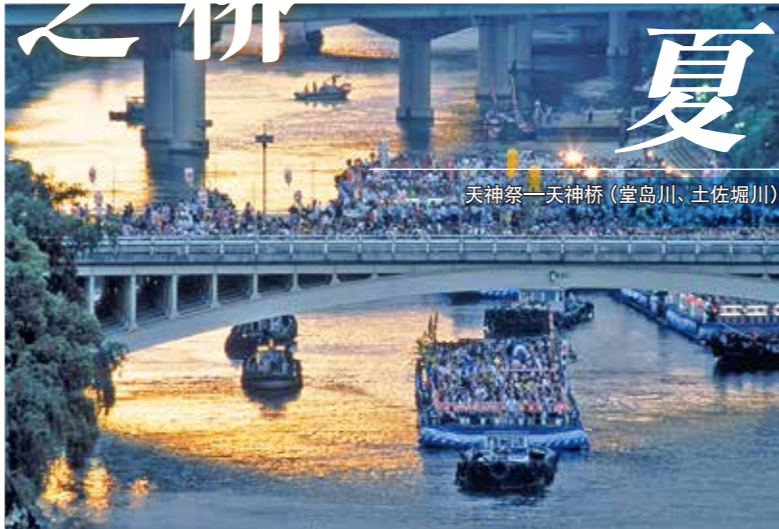
夏 天神祭—天神桥(堂岛川、土佐堀川)