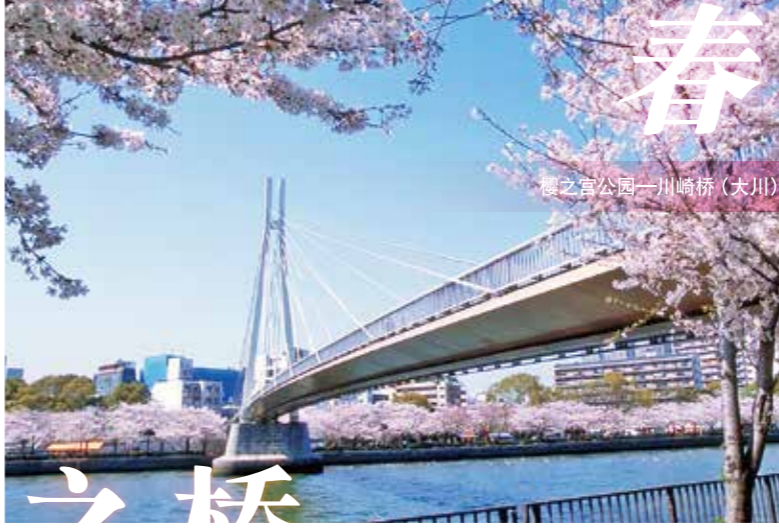
春 樱之宫公园—川崎桥(大川)