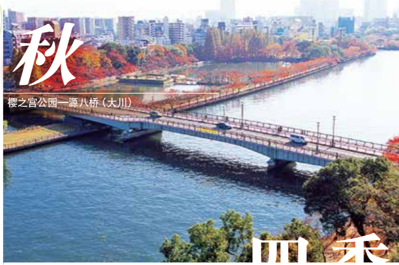
秋 樱之宫公园—源八桥(大川)