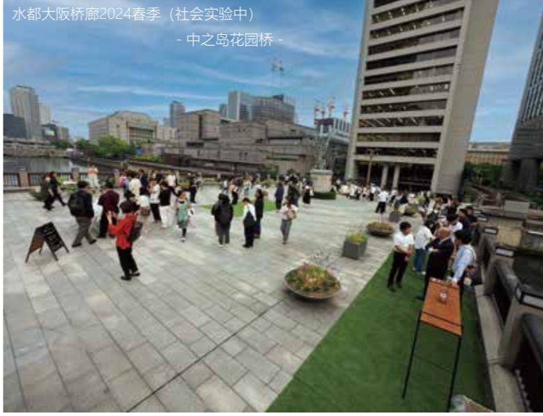
水都大阪桥廊2024春季 (社会实验中) - 中之岛花园桥 -