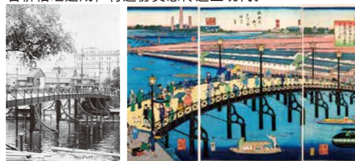
高丽桥（大阪第一铁桥 1870年） 浪花繁荣东堀铁桥图

明治维新之际，随着西洋文明的传入，木桥向铁桥的转变拉开了序幕。从大正到昭和时期，随着市电的发展和第一次都市计划事业的推进，众多承载着优雅风姿的名桥相继建成，将这份美感传递至现代。