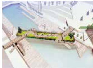
浮庭桥 最优秀作品

采用以“浮游草地”为灵感的绿意盎然的设计方案。同时通过公开征集桥名，最终选定了一个完美诠释设计理念的名称。