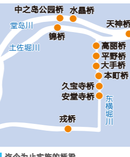
迄今为止实施的桥梁

大阪的桥梁是市民和地区珍贵的财富。通过以当地居民为主导的清扫活动等举措，桥梁不仅受到人们的喜爱并保持着美丽风貌，更促进了城市的繁荣与活力。