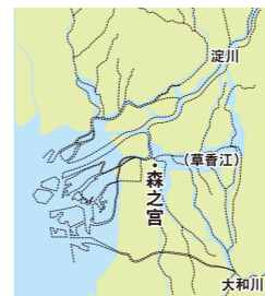
仁德天皇时期的大阪（约5世纪）

大阪桥梁的历史可追溯至仁德天皇时期的古坟时代。此后，在奈良、平安、镰仓及战国时期，桥梁屡见于史书与传说之中，但其中多数仍笼罩着神秘面纱。