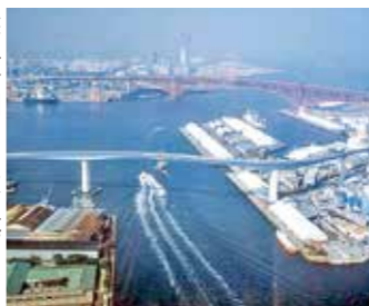
波速大桥-港大桥 海湾地区

战后，在机动化发展背景和桥梁技术进步的背景下，淀川、大和川及湾区等地相继建成运用尖端技术建造的大型桥梁。近年来，这些代表性桥梁不仅获得表彰，还通过灯光秀等修景工程得到全面提升。