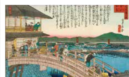
筑地蟹岛（今桥）

由此可见，大阪展现出“町人经济实力的丰厚”，江户则体现“幕府腹地军事战略的重要性”，两座城市呈现出截然不同的城市特征。