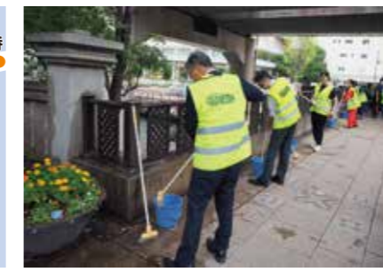
本町桥的洗桥仪式