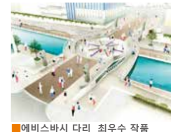
에비스바시 다리 최우수 작품

시민들이 원하는 다리에 대한 설문조사를 실시한 후, 디자인 공모를 실시하여 다리 위 광장의 극상성과 배리어프리로 설계된 디자인이 채용되었습니다.