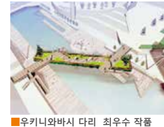
우키니와바시 다리 최우수 작품

'떠 있는 들판'을 이미지한 풍요로운 자연의 디자인이 채용되었습니다. 이와 더불어 다리 이름도 일반 공모하여 디자인 컨셉트를 잘 표현한 이름으로 결정되었습니다.