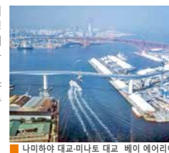
나미하야 대교·미나토 대교 베이 에어리어

2차 세계대전이 끝난 후, 모터라이제이션과 교량 기술의 발달을 배경으로 요도가와·야마토가와 강과 베이 에어리어에서는 최첨단의 기술을 구사한 장대교가 건설되었습니다. 최근, 대표적인 다리의 현상비와 야간 조명을 비롯한 경관 정비 등도 추진되고 있습니다.