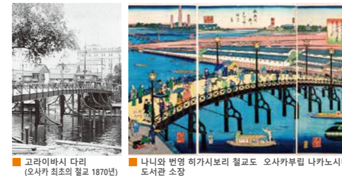
고라이바시 다리 (오사카 최초의 철교 1870년) 나니와 번영 히가시보리 철교도

메이지 유신과 함께 서양 문명이 들어와 나무다리에서 철교로 바뀌기 시작하였습니다. 다이쇼시대부터 쇼와시대에 걸쳐 시영 전철의 발달과 제1차 도시계획 사업에 의하여 그 우아하고 아름다운 모습을 오늘날에 전하는 명물 다리가 잇달아 건설되었습니다.