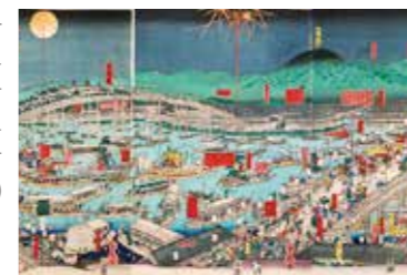
나니와 덴마 축제

'도요토미 히데요시'의 오사카 성 축성과 함께 동서 양쪽의 요코보리와 강이 굴착되었으며, 다시 에도시대에 접어들면 도톤보리와 강이 굴착되고, 수많은 다리가 놓여지면서 '나니와(오사카)의 808개의 다리'라고 불리게 되었습니다.