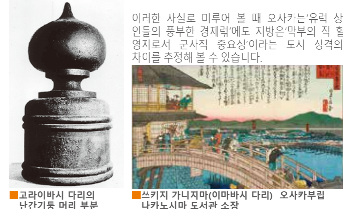
고라이바시 다리의 난간기둥 머리 부분 쓰루지 가니지마(이마바시 다리)