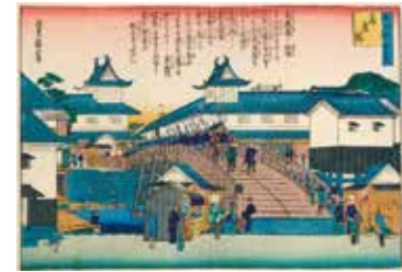
고라이바시 다리

에도시대의 교통에 있어서 다리는 중요한 역할을 담당하였기 때문에 막부가 직접 관리한다는 뜻으로 난간법주를 장식한 '고기바시(公儀橋)'와 유력 상인 또는 주변 지역 주민이 관리하는 '마치바시(町橋)'로 구분되었습니다. 오사카에는 '고기바시' 다리가 12개로 에도 지방과 비교하면 크게 적었고, 대부분은 '마치바시' 다리였습니다.