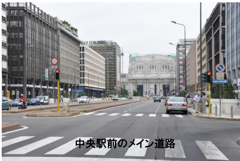
中央駅前のメイン道路