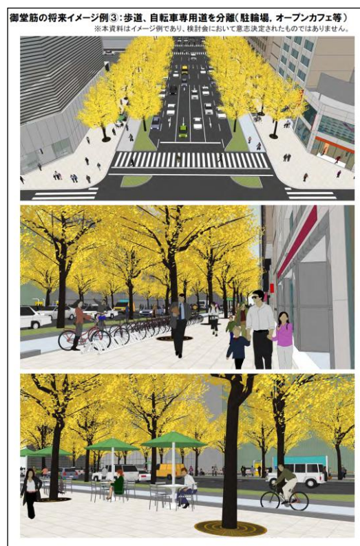
図 御堂筋の将来イメージ例