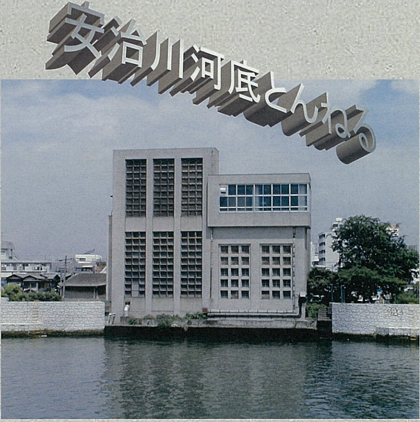
エレベーターが設置されている建物（川の底にトンネルがあります）