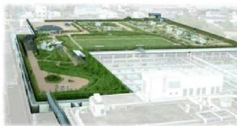
上部利用施設(イメージ)