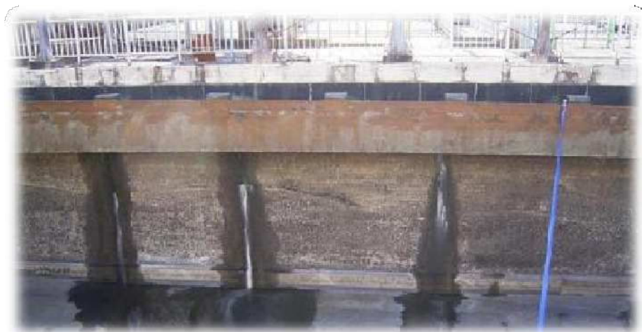
水処理施設の漏水