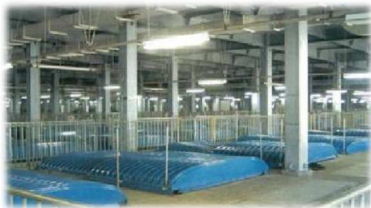
水処理施設における二重覆蓋