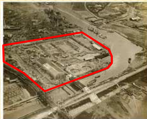
完成間近の 海老江下水処理場