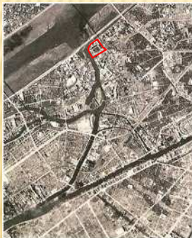
海老江下水処理場付近 航空写真（昭和20年頃）