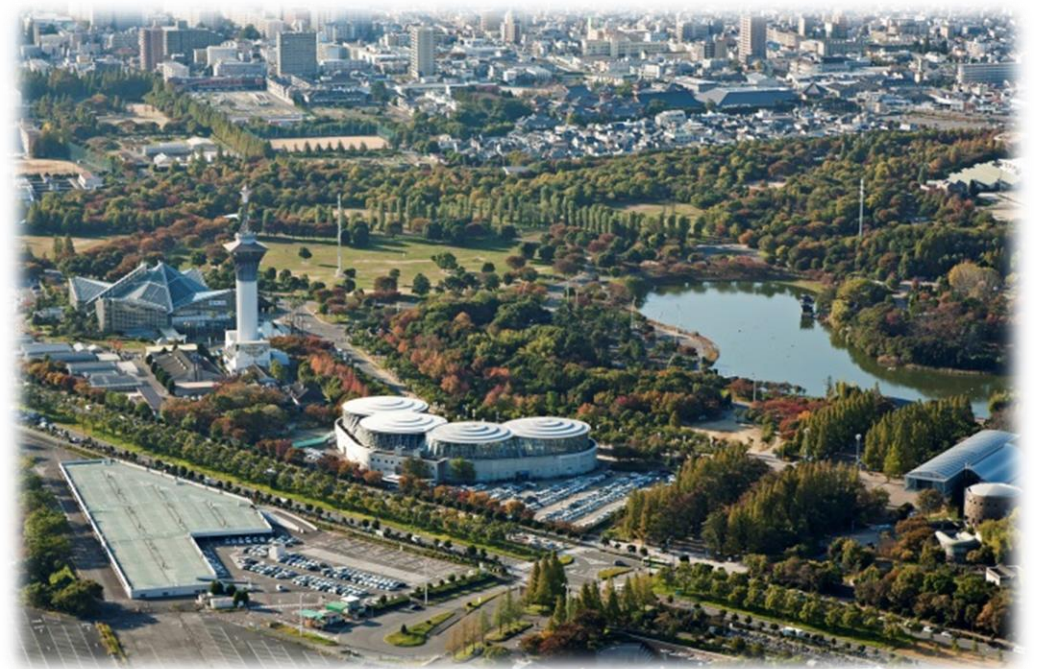
【花博記念公園鶴見緑地航空写真(2011年度撮影)】