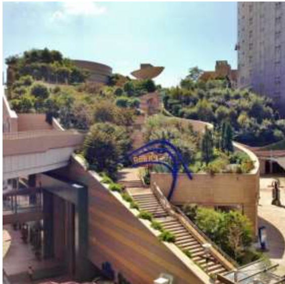
まちなかの魅力あるみどり 「なんばパークス」

公園緑地の新たな機能展開 (まちづくり拠点、健康づくり、社会的つながり・居場所づくり、密を避けるオープンスペース)