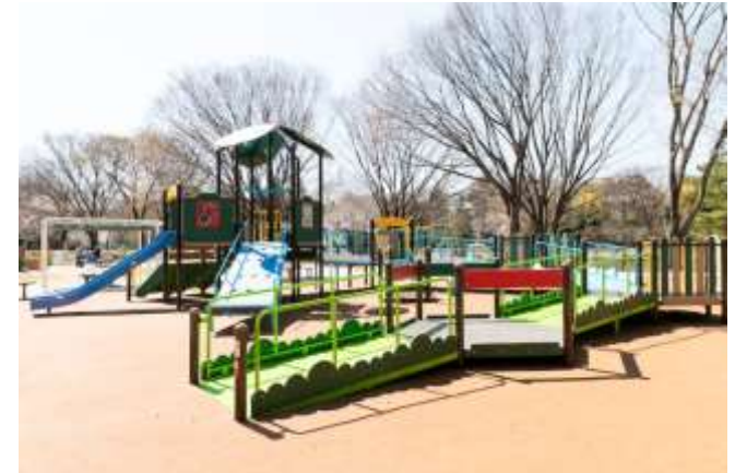
【ユニバーサルデザインの観点が遊具・ベンチ、舗装など随所に施された公園（東京都砧公園）】