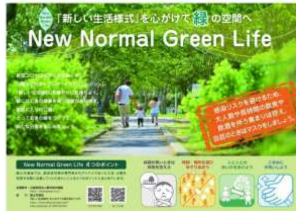
「新しい生活様式」を心掛けて緑の空間へ New Normal Green Life