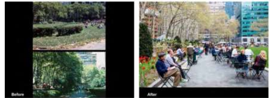
Bryant Park Corporation 資料より

出典：都市の緑量と心理的効果の相関関係の社会実験調査について (国土交通省 都市・地域整備局 公園緑地課 緑地環境推進室)