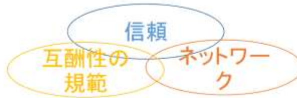
【ソーシャル・キャピタルの概念図】