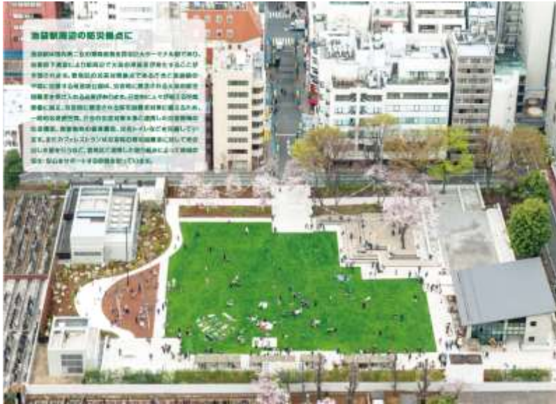
《新しい都市部における公園「南池袋公園」》