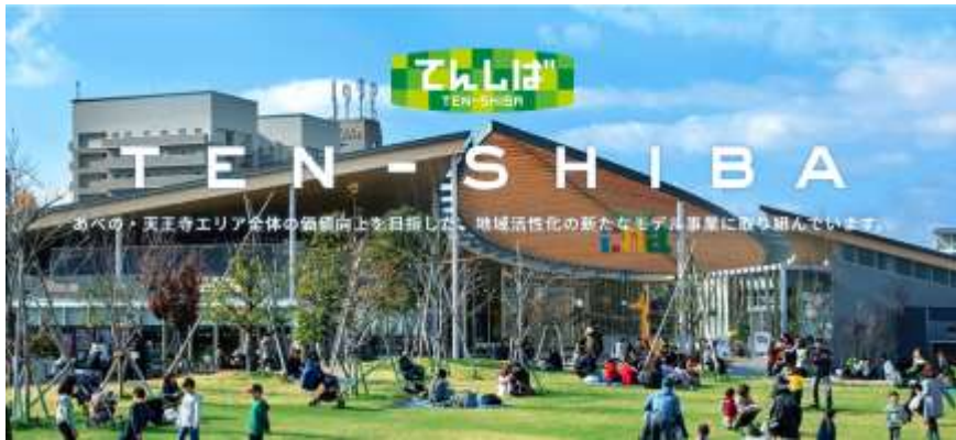
《新しい都市部における公園「てんしば」》