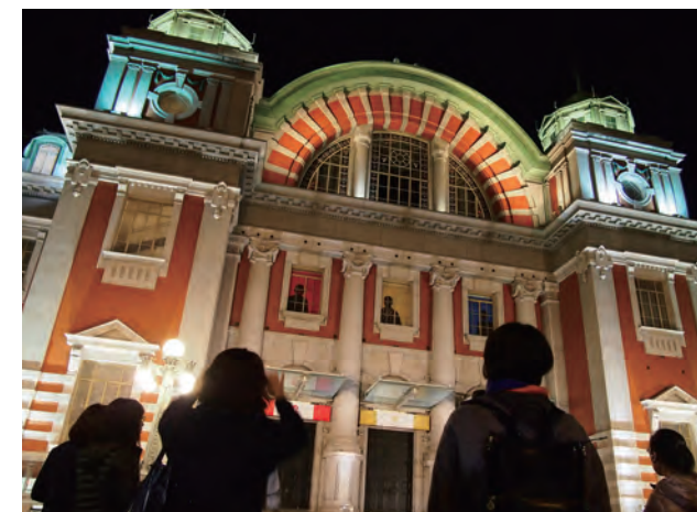
(主な見学場所)日本銀行／芝川ビル／中央公会堂／錦橋／中之島ガーデンブリッジ／大江橋・淀屋橋／水晶橋 など