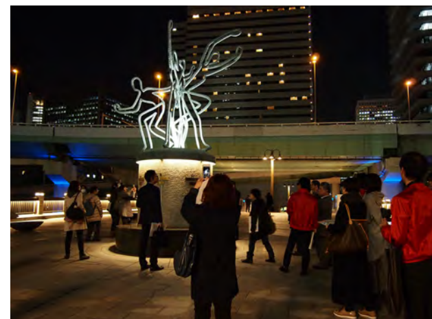
(主な見学場所)日本銀行／芝川ビル／中央公会堂／錦橋／中之島ガーデンブリッジ／大江橋・淀屋橋／水晶橋 など