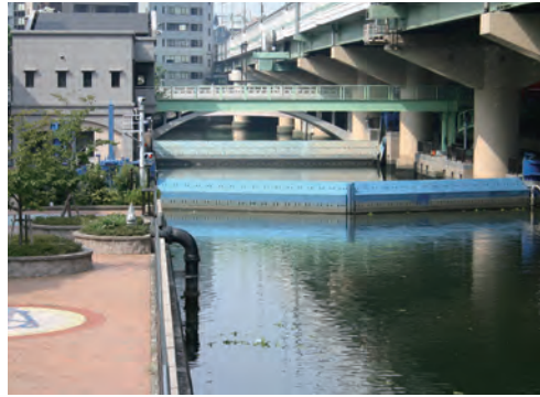
(主な見学場所) 道頓堀川・東横堀川の水辺・橋梁／東横堀川水門

道頓堀川・東横堀川を電気船「あまのかわ」で巡り、普段まちから見ている水辺や橋を船から見ることで、川や橋の役割や魅力を再発見していただくとともに、下船後は東横堀川水門を見学しました。