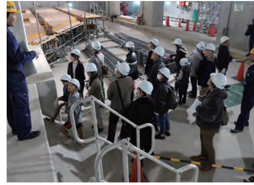
(主な見学場所) 地下空間施設(JR大阪駅南側の東西地下道)の工事現場

道路の地下空間は、地下道やライフラインなどの様々な公共施設を収容する空間として利用されています。普段は見る事ができないそれらの公共施設の工事現場を見学していただきました。