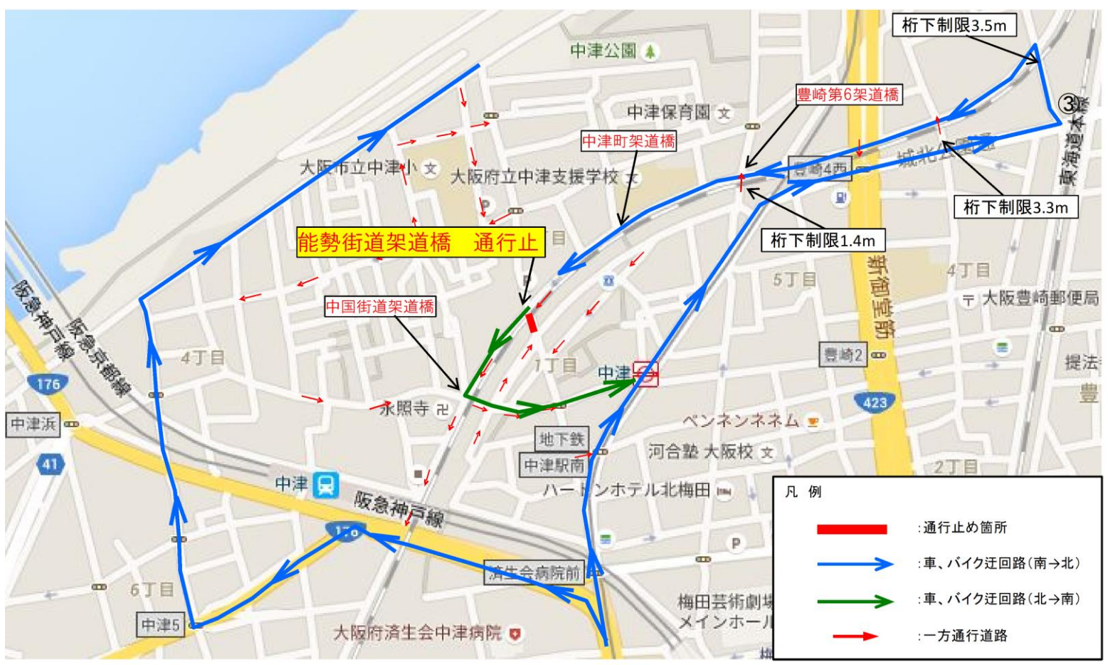
③ 能勢街道架道橋通行止めの場合