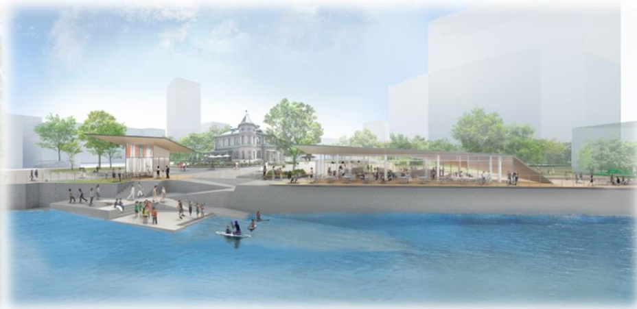
清流公園から公募対象公園施設及び特定公園施設（休養施設）を望むイメージ