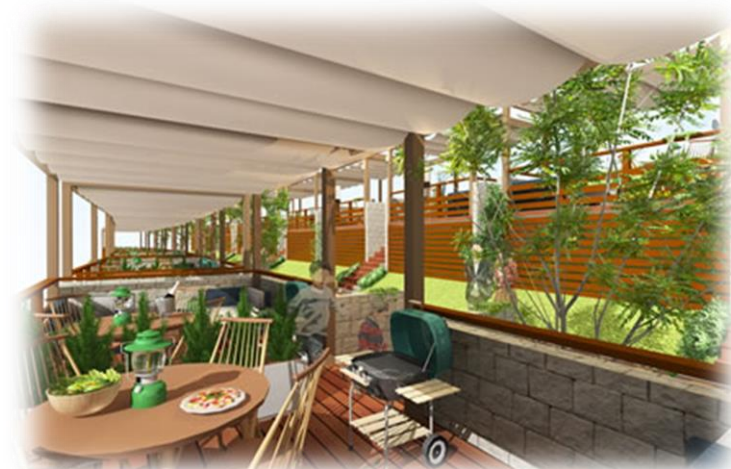
バーベキューエリア内観イメージ