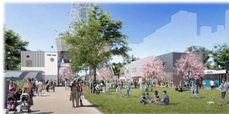
テレビ塔エリア（コミュニケーションゾーン）のイメージ