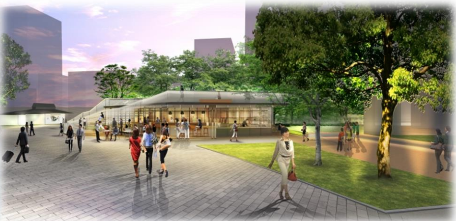
公募対象公園施設及び特定公園施設（トイレ改修）を望むイメージ