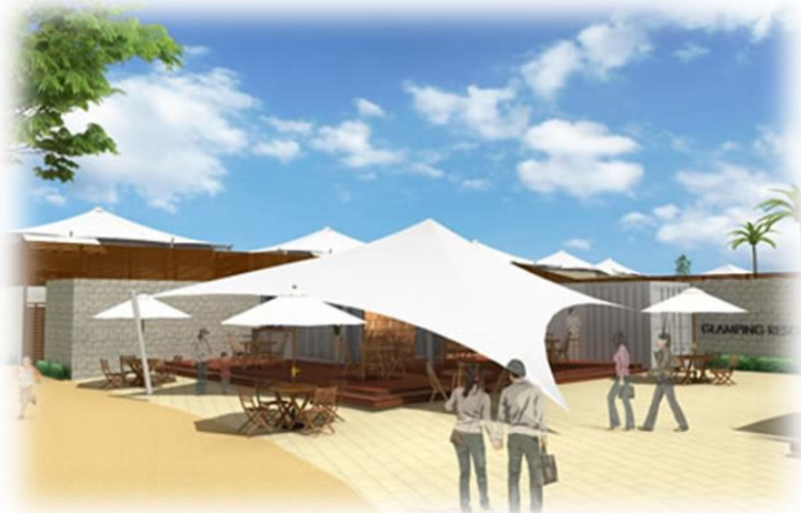
センターハウス棟イメージ

民設民営のキャンプ体験施設等の公園施設(公募対象公園施設)の整備及び管理運営と、周辺の駐車場やエントランススペース、屋外便所等の公園施設(特定公園施設)の整備及び管理運営を行う事業者を公募し、事業者を決定。事業期間は20年間。