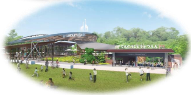
天王寺公園における事例イメージ

本市では、大阪城公園や天王寺公園において民間活力を活用し、それぞれの公園が持つ特性を活かした魅力向上を図ってきましたが、その他の大公園においても、各公園が持つ特性を活かした魅力向上を図っていく予定です。