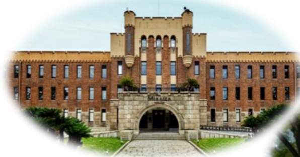
MIRAIZA OSAKA-JO (大阪城公園)

都市公園は、レクリエーション機能、良好な都市景観の形成、都市環境の改善、都市の防災性の向上など多くの機能を備えています。その中でも大規模な都市公園は、都市の中の貴重な緑の拠点であり、地域ひいては都市の活性化拠点となるポテンシャルを有しています。