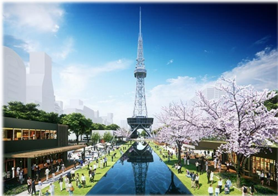
もちの木広場上からテレビ塔を臨むイメージ