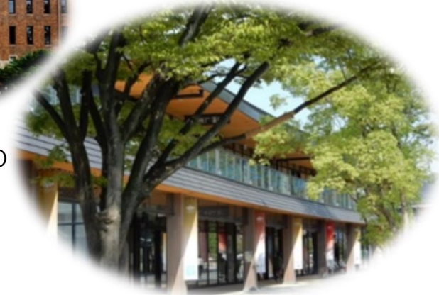
JO-TERRACE OSAKA (大阪城公園)