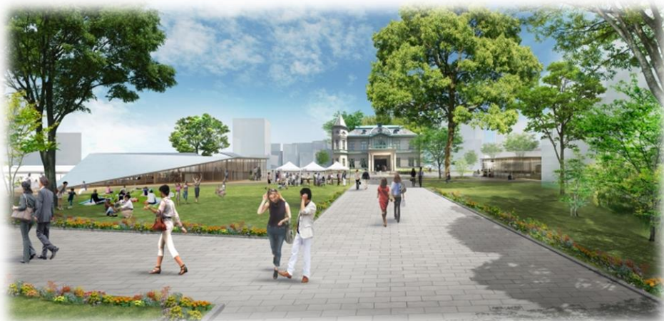
明治通りエントランスから公募対象公園施設を望むイメージ

カフェ&バー、バル、ベーカリー等の公園施設(公募対象公園施設)の整備及び管理運営と、休養施設等の公園施設(特定公園施設)の整備を行う事業者を公募し、事業者を決定。事業期間は20年間。