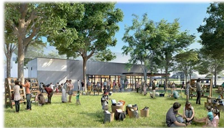
北エリア（学びの森ゾーン）のイメージ