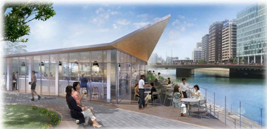
公募対象公園施設を望むイメージ