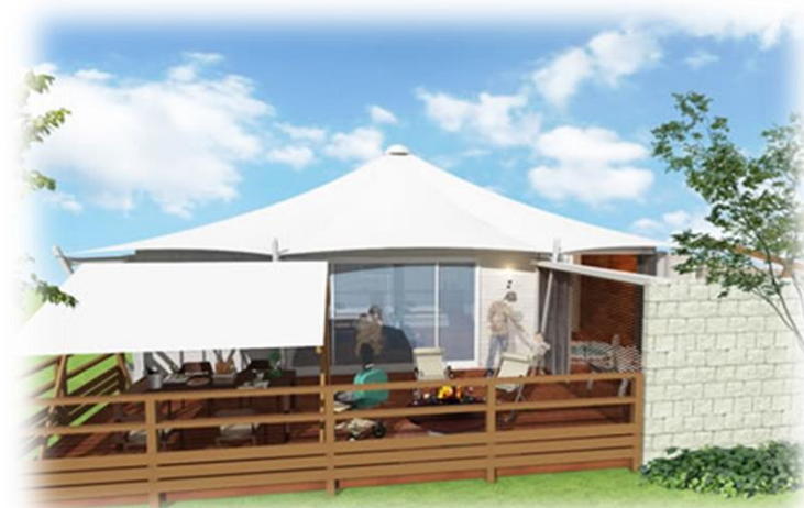
宿泊棟外観イメージ