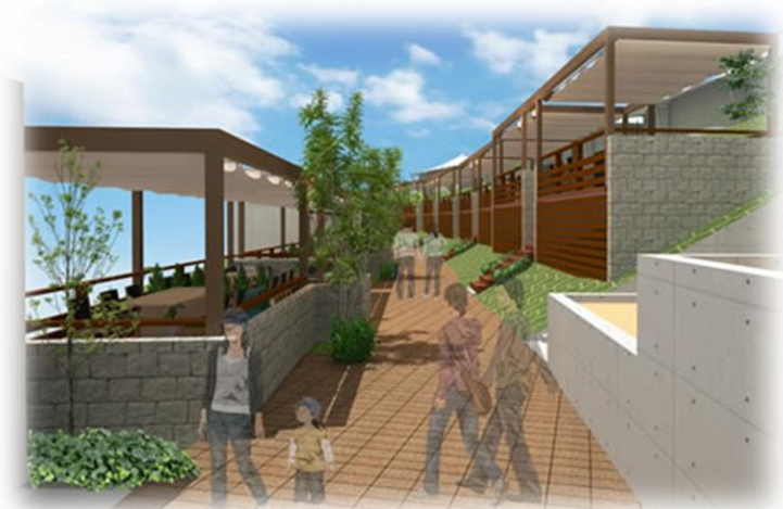
バーベキューエリア外観イメージ