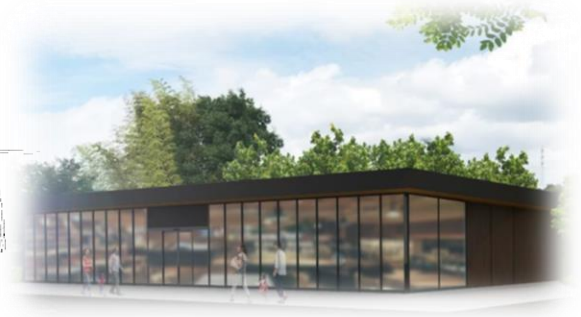
④レストハウス鶴見のイメージ

※ 図中の番号は、「新規施設等の提案」及び「既存施設に係る提案」における番号と対応しています。