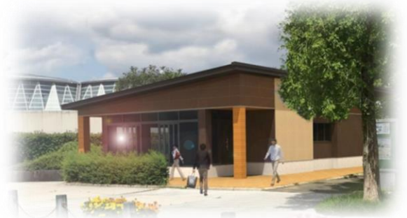
①ベーカリーカフェのイメージ