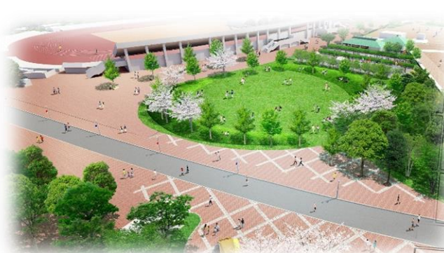
③中央広場の整備イメージ

テニスコートスタンド席の一部木製化、相撲場の移設（再掲）、園内の他施設との連携、長居パークプラットフォームの構築、太陽光発電施設や水質浄化システム、バイオコンポスターの導入 など