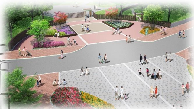
⑥北東ゲートの整備イメージ