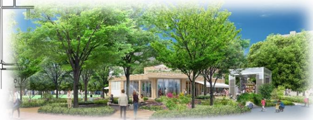
②南広場の整備イメージ