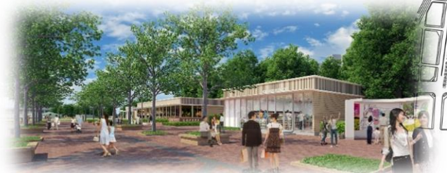
①エントランス広場の整備イメージ