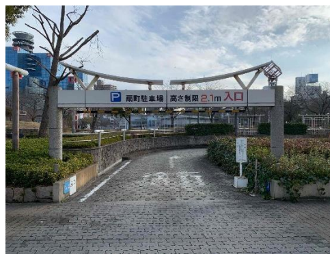
扇町通地下駐車場