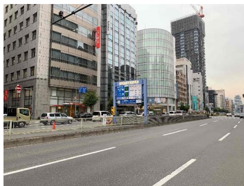
谷町筋地下駐車場