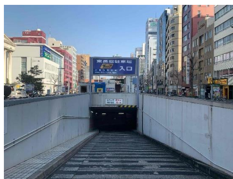
東長堀地下駐車場