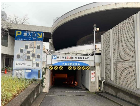
大阪駅前地下駐車場