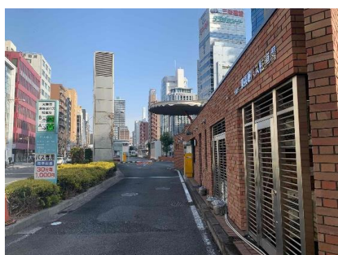
東長堀バス駐車場