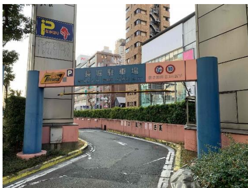
長堀通地下駐車場