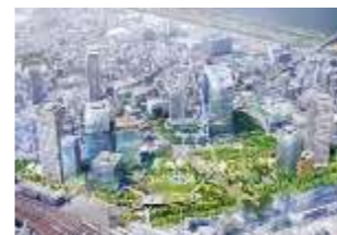
新たなまちの中心となるうめきた2期公園