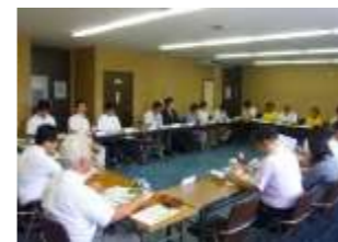
住民・企業等と連携したプラットフォームの設置