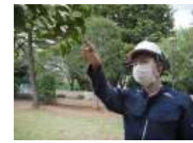
スマートグラスによる業務効率化の検証