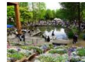
緑を活かした公園の魅力高めるイベントの実施