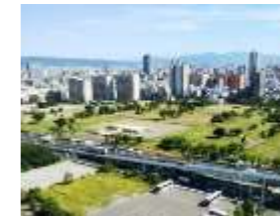
歴史文化観光拠点 難波宮跡公園