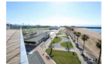
いこい・賑わい拠点 りんく公園エリア