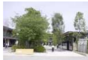
民活による新たな施設設置等による魅力向上