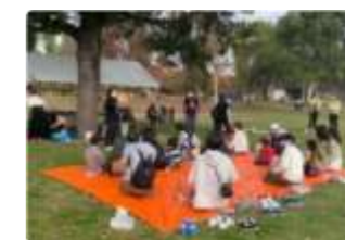
新たな公園の利活用の取組を市から府域全域へ展開