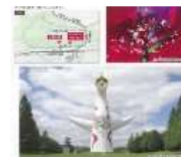
花やイベントなどの情報を府市共通HPなどで発信