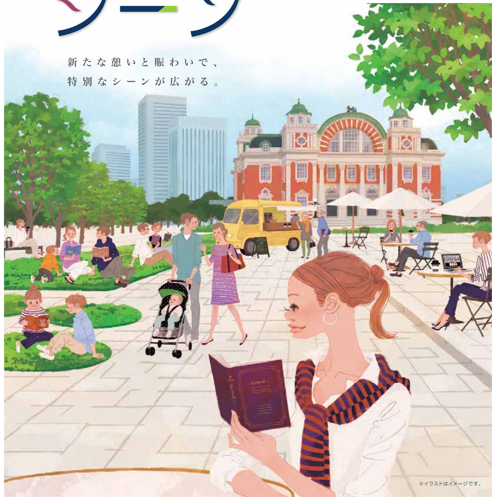
※イラストはイメージです。