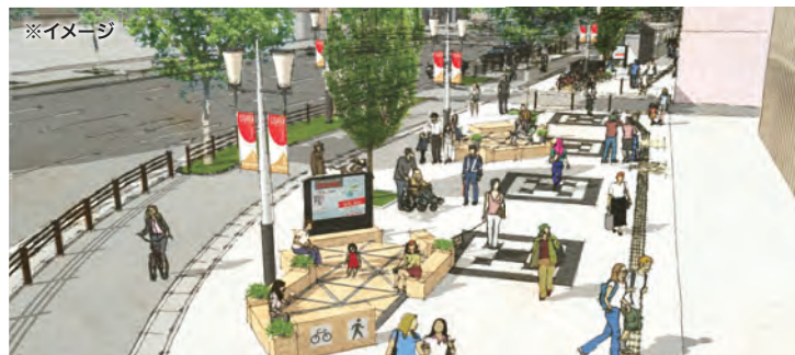
モデル整備区間東側 広がった歩道に滞在空間を作り、回遊を促します。