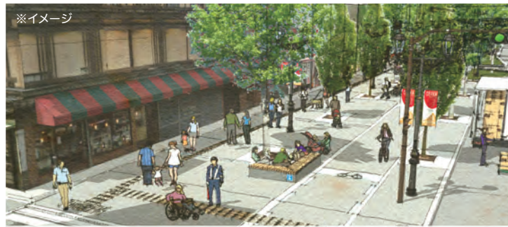
2期整備区間 ※工事完成は来年1月予定 新しい歩道で滞在空間を作り、回遊を促します。

プログラム詳細は ミナミ御堂筋の会ホームページで minami-midosuji.net