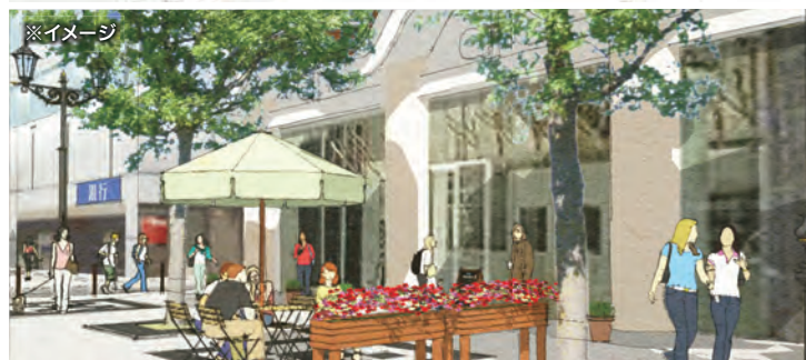
モデル整備区間西側 沿道テナントによるオープンカフェを実施します。