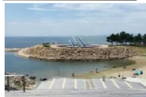
府営りんくう公園（北地区）