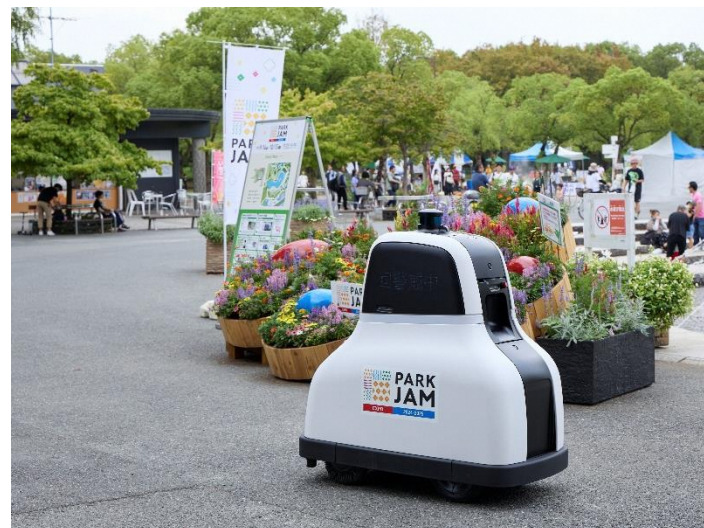
◆ ファームユニット