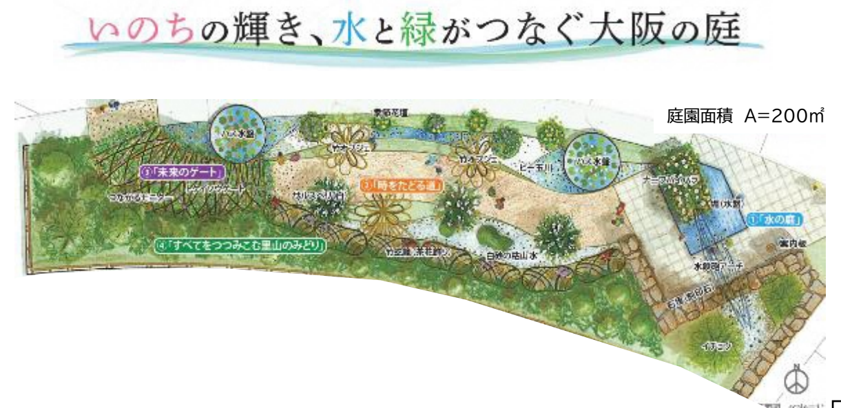
◆国際園芸博覧会への出展

○2027年国際園芸博覧会の共同出展（大阪府・大阪市・堺市）において、基本設計を完了