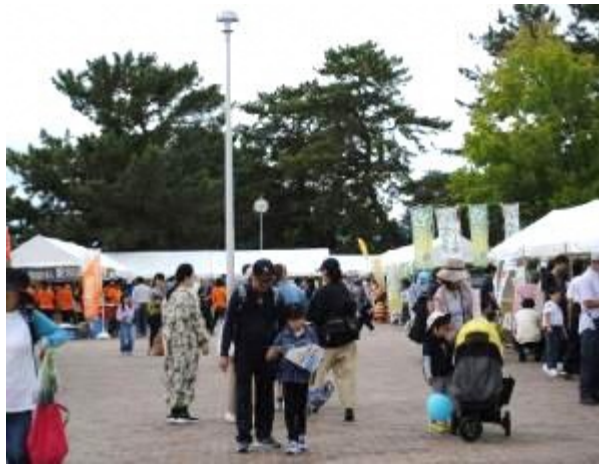
◆おおさか都市緑化フェア（服部緑地）

○ おおさか都市緑化フェアやPARKJAMにおいて、府市連携のもと、各公園のPRや2025年大阪・関西万博のPRブースを出展