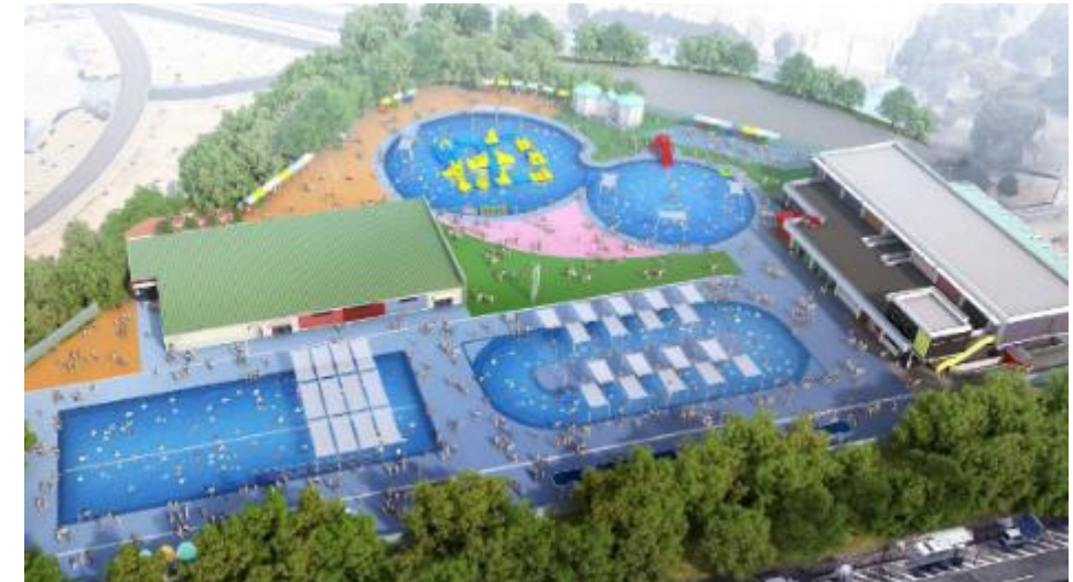
◆ 久宝寺緑地（プール）

※上記画像はイメージであり、今後、関係機関との協議を踏まえ変更の可能性があります。