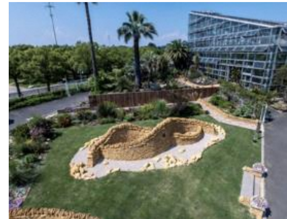
◆ 鶴見緑地（エルフガーデン・ダイナソーアドベンチャー）