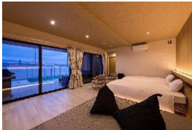
◆ 二色の浜公園（宿泊施設・飲食店）