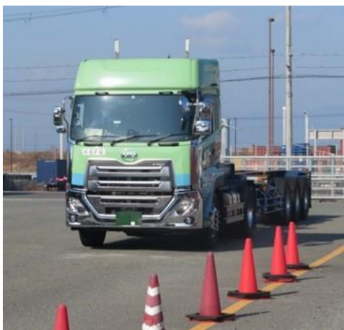
① CONPAS予約車のターミナル到着

令和4年1月27日, 28日に夢洲コンテナターミナル(株) (DICT) が運営するコンテナターミナルにおいて試験運用を実施