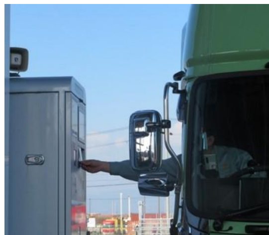
② INゲートでの入場手続き (PSカードの読取り)