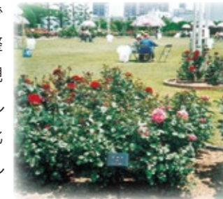
バラ園(住之江下水処理場)

住宅が密集している大都市では、下水処理場や抽水所(ポンプ場)は貴重な都市空間です。大阪市では、レクリエーション施設や憩いの場などとして利用できるよう、さまざまな施設を整備しています。また、市民に親しまれる下水処理場をめざして、花の咲く木を中心に緑化を行い美しい景観を創り出しています。