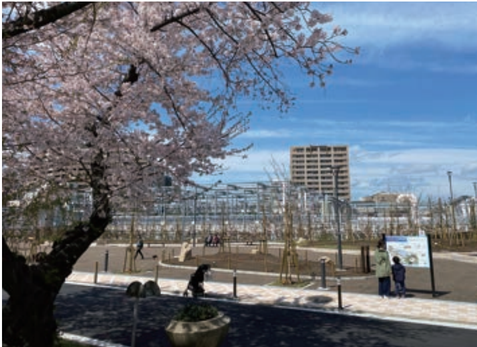
中浜せせらぎの里

●いこいの空間 下水道施設の一部を有効利用した多目的広場など、市民のいこいの場を提供しています。