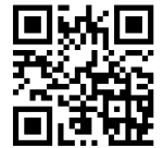
ホームページ QR コード