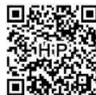
ホームページ QRコード

●大阪ファミリー・サポート・センター事業のご案内 北支部 TEL06-6374-7271 火曜日～日曜日 9:00～17:30 北区在住の「子育てを援助してほしい人」と「子育てを援助したい人」を会員として、互いに子育てをささえあう仕組み です。利用には会員登録が必要です。入会ご希望の方は電話で問い合わせのうえ、ご予約ください。