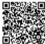
北区ホームページ