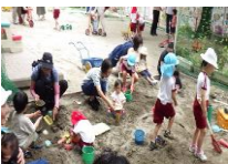
お庭でも遊べます

* 2月12日(木曜日)、3月17日(火曜日)に実施予定です。幼稚園のHPに、未就園児活動の開催日、時間帯、内容などの詳細を載せています。園生活の様子が掲載していますのでご覧ください。