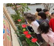
園前で植物の生長を観察!