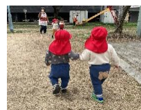
乳児クラスお散歩の様子

★(持ち物) 室内履き(室内スリッパに限りがあるため、ご協力いただける方はお願いします。)