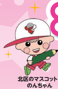
北区のマスコットのんちゃん