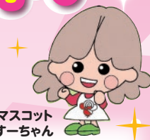
北区のマスコットすーちゃん