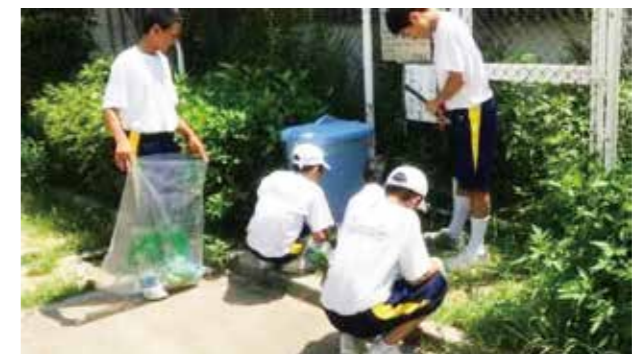
地区奉仕活動(年2回の地域清掃)