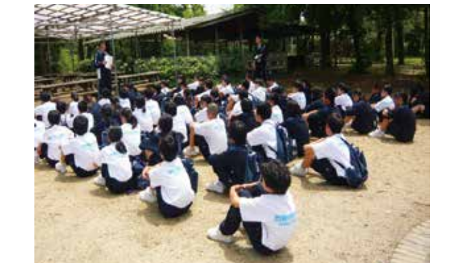
一泊移住(大阪市立信太山青少年野外活動センター)