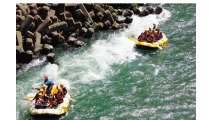
修学旅行(信州方面)