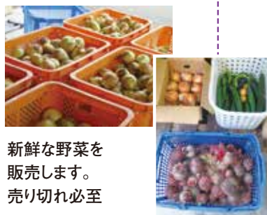
新鮮な野菜を販売します。売り切れ必至