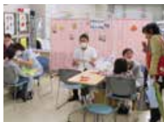
虫歯予防に、 小学6年生以下限定

18歳以上の市民 先着100名 (13:00~整理券配布) 検診を受けると 骨を丈夫にする タンパク質 「MBP」を含む飲料が もらえます