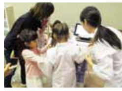
小さな白衣を着て、お菓子を使った調剤を体験できます