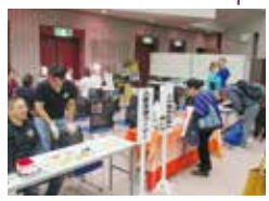
医師、歯科医師、薬剤師による無料相談